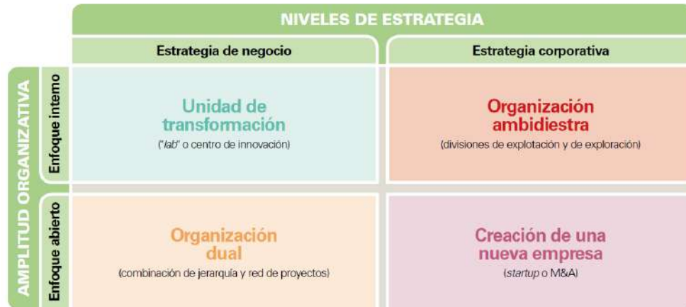
Figura 9. Modelos de desarrollo innovador.

involucrados. Pretende una transformación más estrecha e interna por lo que la cultura empresarial debe ser favorable a su creación y propósito transformador. Su localización puede estar en la misma sede de la empresa o bien situarlo cerca de la universidad o de centros de emprendedores. Requiere de una cultura de colaboración entre las diferentes unidades funcionales o departamentos.