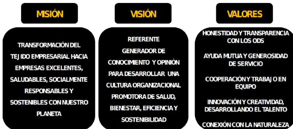
Figura . El PORQUÉ de MIESES GLOBAL

Para definir el plan estratégico se ha seguido el modelo circular de las decisiones estratégicas, expuesto en la presente Guía. En su parte central se ha establecido el PORQUÉ de Mieses, su razón de ser, concretando la Misión, Visión y Valores, así como su Propósito